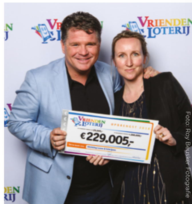
De bijdrage van de VriendenLoterij zetten we in om het taboe rond laaggeletterdheid te doorbreken.

VriendenLoterij Het taboe rond laaggeletterdheid veroorzaakt vaak schaamte bij laaggeletterden. De jaarlijkse bijdrage van onze vaste partner de VriendenLoterij zetten we in om dit taboe te doorbreken. Hiervoor ontwikkelen we innovatieve