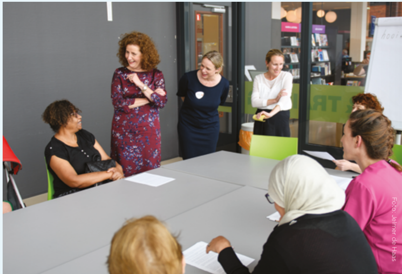
Minister Ingrid van Engelshoven in gesprek met deelnemers.

Veel vrouwen bezoeken wekelijks de Sollicitatiehelpdesk in Bibliotheek Kanaleneiland. Zij krijgen er ondersteuning bij het zoeken naar vacatures en het solliciteren en zij werken tegelijkertijd aan hun taalvaardigheid. Een vrouwelijke deelnemer merkte op dat ze het jammer vindt dat veel vacatures alleen online te vinden zijn: als je bijvoorbeeld door geldgebrek geen computer en internetaansluiting thuis hebt, is het lastig een 16 geschikte baan te vinden. Een andere vrouw gaf aan dat zij vanwege discriminatie bijna nooit uitgenodigd wordt voor een sollicitatie. De minister nam de kennis en adviezen van deze dag mee naar het AO Laaggeletterdheid in de Tweede Kamer.