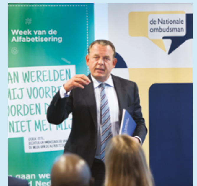
De ombudsman met het aangeboden onderzoek.