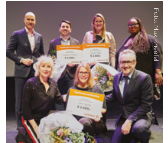
Winnaars van de landelijke TaalHeldenverkiezing 2017.

Ook in de aanloop naar de TaalHeldenverkiezing maakten onze Taalambassadeurs laaggeletterdheid zichtbaar en invoelbaar via indringende portretten en interviews: OneWorld, Algemeen Dagblad Tiel, Algemeen Dagblad Utrecht, RTV Oost, Omroep Brabant. Van deze evenementen werd verslag gedaan door Koffietijd en Shownieuws, Tijd voor Max en Blauw Bloed.