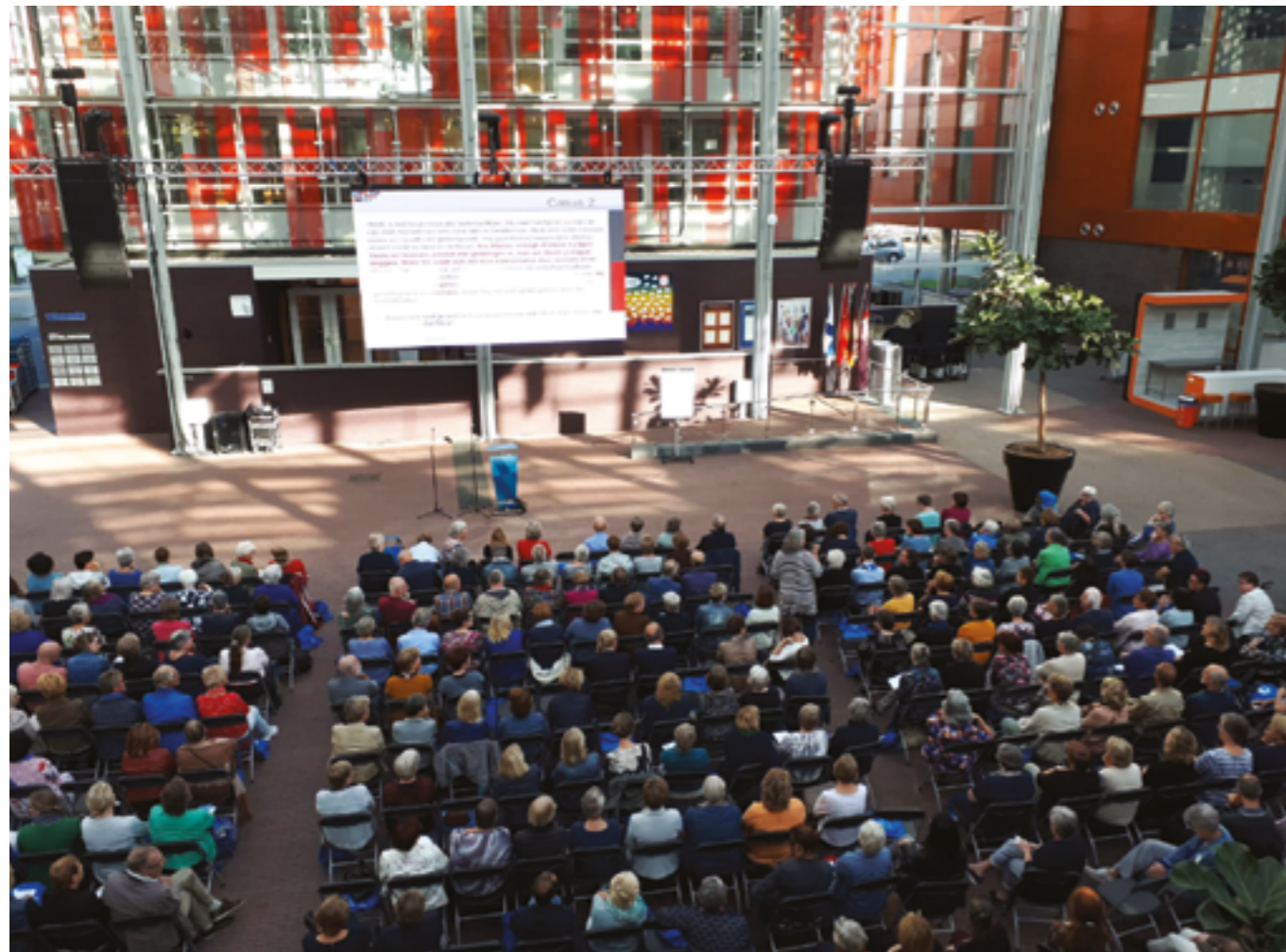
Drukbezochte vrijwilligersdag in Zwolle.

deelnemer over de workshop intercultureel bewustzijn, studiedag Midden, 14 september