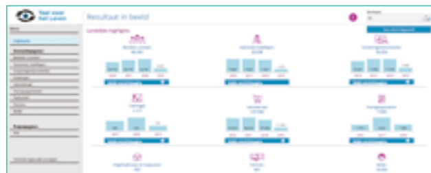
Resultaat in beeld

Tenslotte geven de partnerorganisaties elk kwartaal door hoeveel cursisten en vrijwilligers er met de programma's Taal voor het Leven en/of EVA meedoen. Deze gegevens, en die van de andere instrumenten en het lesmateriaal, komen terecht in Resultaat in beeld. Dit dashboard biedt inzicht in de resultaten en activiteiten van Taal voor het Leven. In 2018 is Resultaat in beeld gelanceerd voor gebruik.