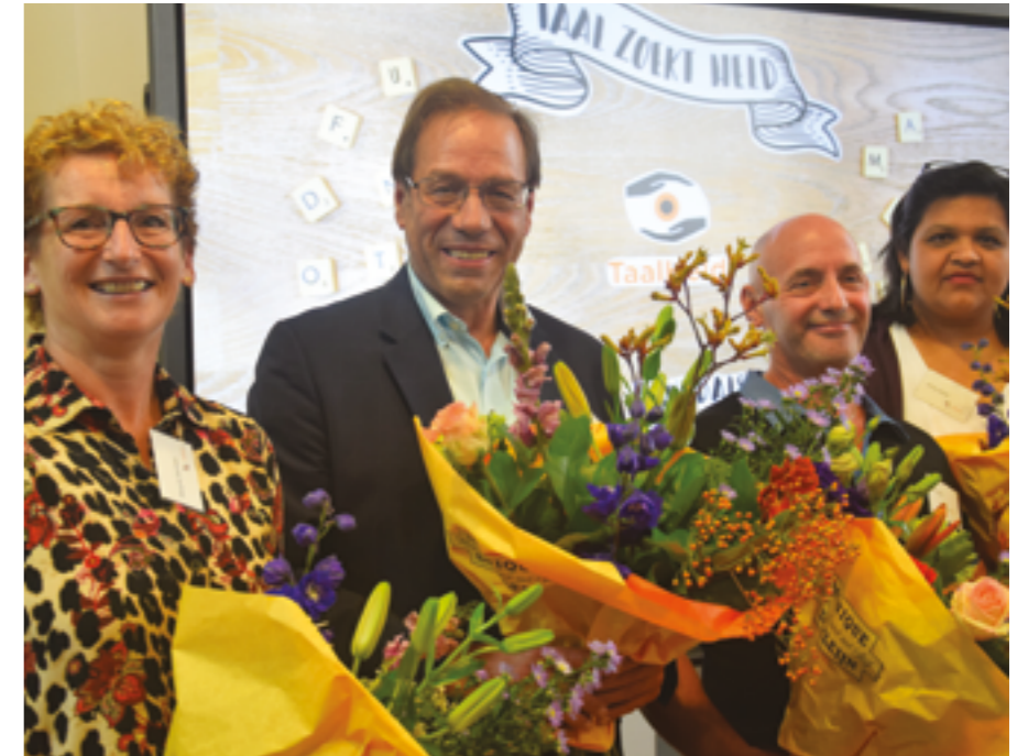
Winaars van de Provinciale TaalHeldenprijs in Brabant.

Tijdens de campagne traden overal in het land tal van dichters op die voordrachten verzorgden uit de dichtbundel DICHTER. Tem de Tekens. Deze bundel hebben wij samen met uitgeverij Plint met een oplage van 10 duizend exemplaren opgeleverd met ruim 60 gedichten over laaggeletterdheid. De gedichten kwamen ook terug op abri's, posters, flyers en sociale media.