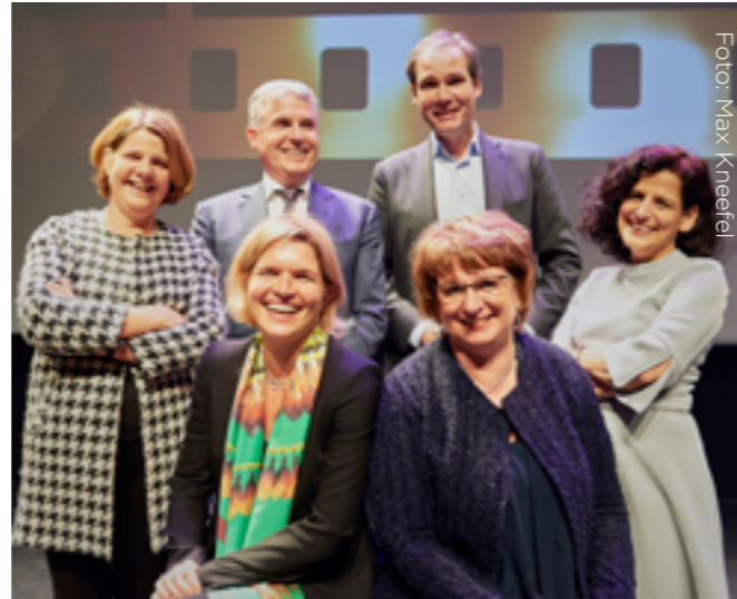
Raad van toezicht

Stichting Lezen & Schrijven onderschrijft de maatschappelijke normen voor 'goed bestuur'. De raad van toezicht speelt daarbij een belangrijke rol. De raad van toezicht houdt integraal toezicht op het beleid en de algemene gang van zaken van de