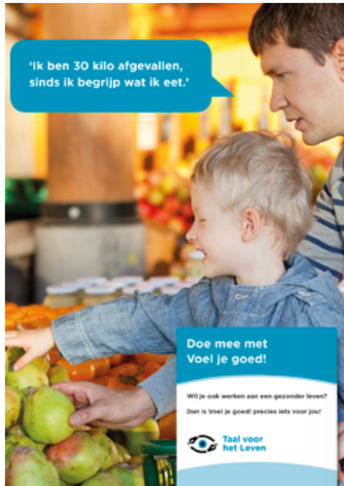
Flyer om deelnemers te werven voor Voel je goed!

Meerjarige financiering van Voel je goed! is in de pilotplaatsen tot nu toe nog niet gelukt, wel is het gelukt de pilot in 2019 in de meerderheid van de pilotplaatsen voort te kunnen zetten. In 2018 is Voel je goed! in drie gemeenten: Veendam, Pekela en Midden-Groningen gestart. Later in 2018 volgden nog een zevental andere gemeenten (Amsterdam, Delfzijl, Drachten, Nieuwkoop, Nijmegen, Oldambt en Steenwijkerland). In een vijftal andere steden zijn gesprekken gaande.