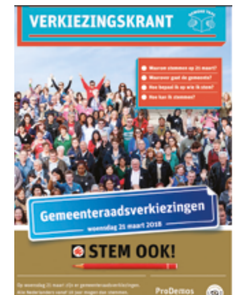
Verkiezingskrant voor de gemeenteraadverkiezingen in 2018

Naast aandacht voor de gemeenteraadverkiezingen op taalbegintlokaal.nl, pleitte Stichting Lezen & Schrijven voor het belang van begrijpelijke taal rond de verkiezingen. Zo ontwikkelden we samen met ProDemos de Verkiezingskrant in begrijpelijke taal. Zo kunnen meer mensen goed geïnformeerd hun stem uitbrengen. Daarnaast hebben we een menukaart voor alle (lokale) politieke partijen opgesteld waarin staat hoe ze laaggeletterdheid kunnen opnemen in hun verkiezingsprogramma.