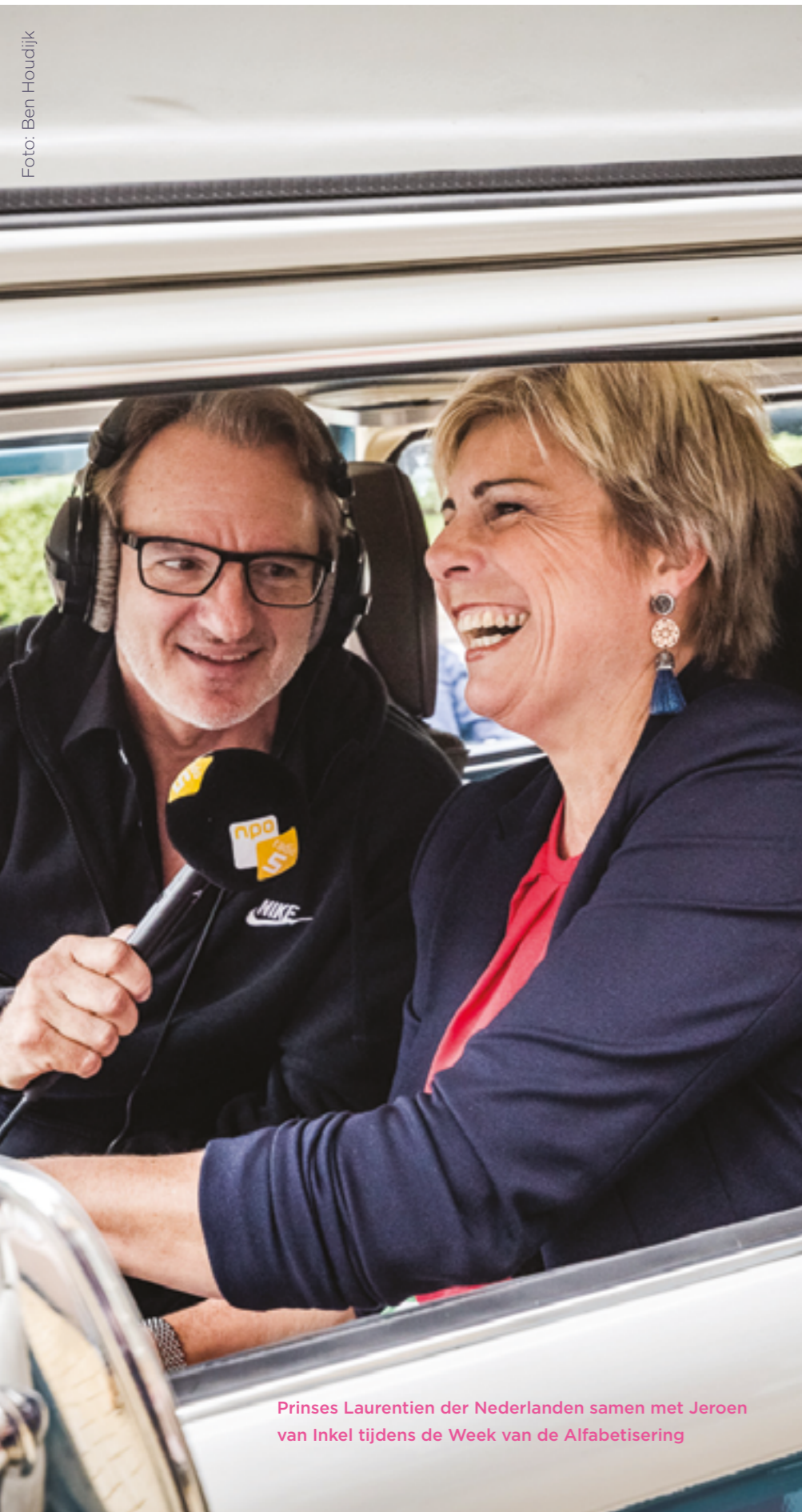
Prinses Laurentien der Nederlanden samen met Jeroen van Inkel tijdens de Week van de Alfabetisering

Op 8 september is het Wereldalfabetiseringsdag. Rondom deze dag organiseert Stichting Lezen & Schrijven elk jaar de Week van de Alfabetisering. In deze week vragen we samen met honderden partners aandacht voor laaggeletterdheid in Nederland.